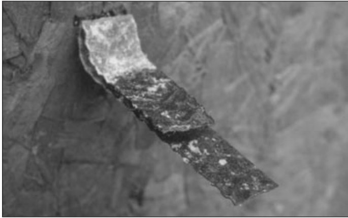
Figure 2. Agrafe ondulée galvanisée : la partie qui était noyée dans le joint de mortier est corrodée.

battante; celle-ci donne une idée des régions du Canada où le parement de façade risque d'être le plus mouillé.